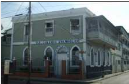
En este lugar se reunía la asamblea antes de mudarse a la Calle Sucre. Hoy funciona allí el Colegio Evangélico