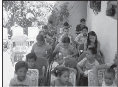
Pequeña clase bíblica, que funciona en el patio de la casa de una creyente

a: Su forma de conducirse en la casa de Dios, sus palabras y su forma de vestir... Se dice que en una ocasión un maestro joven llegó a la clase con un corte moderno (con tendencia punk), mientras él hablaba, sus alumnos no le escuchaban sino que en sus mentes se preguntaban ¿Qué le pasó al maestro? ¿Por qué vino con ese corte tan raro?